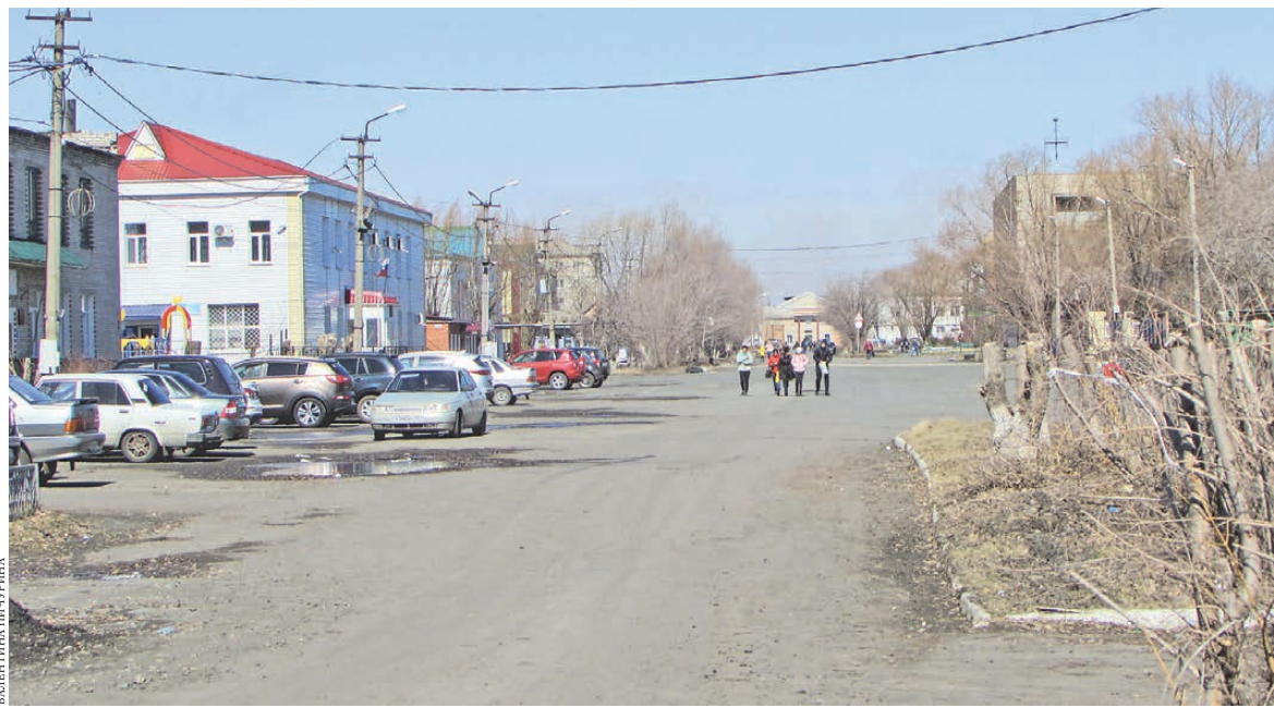
Петухово—небольшой провинциальный городок с населением 10 тысяч человек.

С тех пор почти ничего не изменилось. Только вместо большого наземного тракта проложили федеральную трассу, а обозы заменили фуры. Правда, на границе появились многосторонний автомобильный пункт пропуска и пограничный пост. Была еще таможня, но после образования Таможенного союза ее