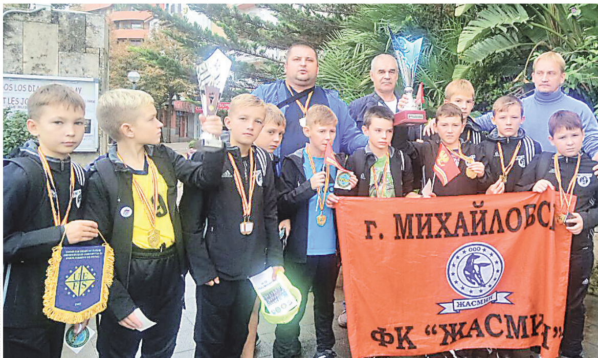
Из Испании уральские мальчишки вернулись чемпионами.

В прошлом году мальчишки из ФК «Жасмин» заняли первое место на проходившем в Испании открытом Кубке Европы по футзалу и микрофутзалу среди детей 2005–2006 годов рождения. Чтобы получить путевку на чемпионат, каждая из пяти участвовавших в соревнованиях команд должна была одолеть соперников в своей стране. По этому можно судить о доста-