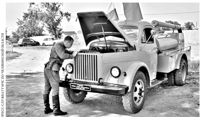
Раритетный ГАЗ-51 на ходу и обладает большим запасом прочности.