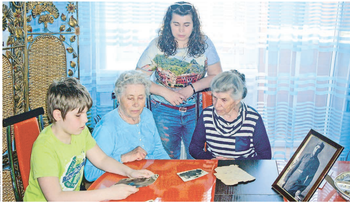
Правнук погибшего бойца Слава хотел бы узнать о прадеде больше.

Ну а дальше про то, как проехали через всю страну — в город Унеча. И что расскажет все через пять месяцев.