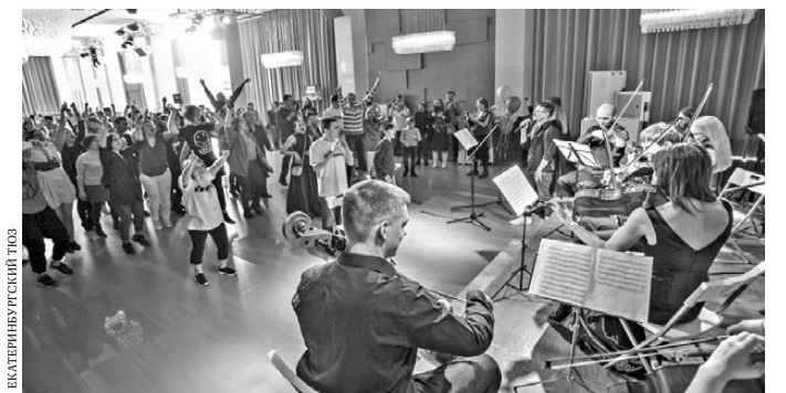
На выступлении инклюзивного театра танца «Другие» и «Другого оркестра» собравшиеся вместе слушали музыку и танцевали.