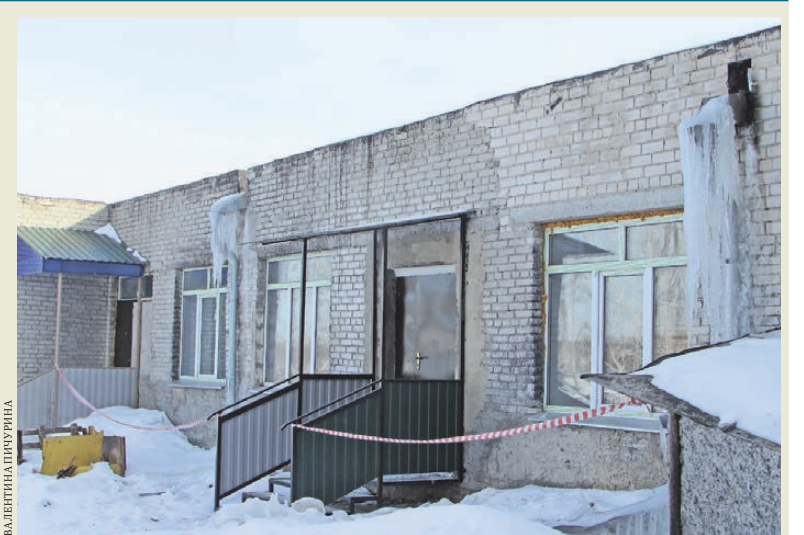
В это здание хотят перевести детский сад.

Кстати, Центр гигиены и эпидемиологии Курганской области нашел нарушения СанПиН в здании, куда хотят перевести детский сад. В заключении от 31 марта 2017 года эксперты, в частности, указывают на дефекты отделки стен: отслоение штукатурки, мокрые желтые пятна, признаки поражения грибком. Кроме того, в помещении нет места для медкабинета, служебно-бытовых комнат для персонала, не предусмотрен пищеблок. Доставлять готовые блюда планируется из школы.