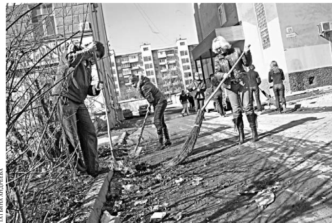
В Екатеринбурге общегородской день чистоты пройдет 29 апреля.