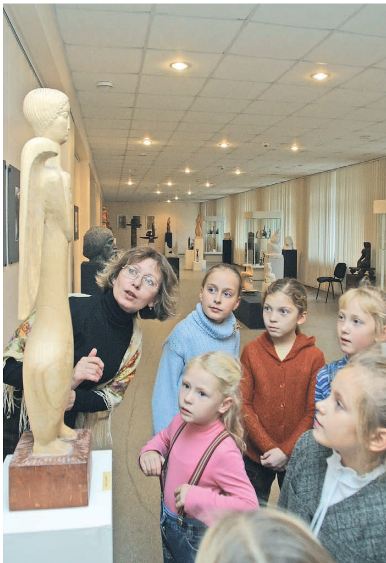
В Тюменском музее изобразительных искусств.

Областной департамент культуры распорядился в считанные дни очистить помещения — подготовить к перемещению 16,5 тысячи экспонатов. Куда? В фондохранилище строящегося поблизости уже пару десятков лет музейного комплекса. Как раз установились сильные морозы. Чем была вызвана спешка, попирающая жесткие регламенты перемещения музейных ценностей? Оказалось, здание поставлено на капремонт, надо срочно обследовать конструкции. Музей будет иной, на стенах вместо привычных картин — мультимедийные проекции. Из бюджета направлено более 10 миллионов на проектно-сметную