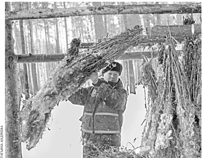
Веники из иван-чая лесники заготавливают для лесей.