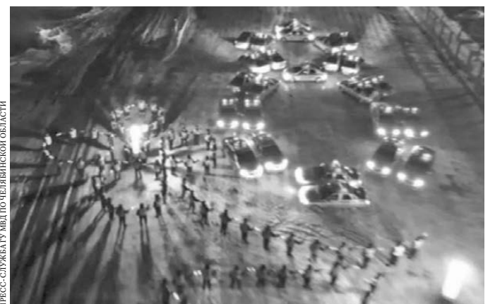
Машины ДПС образовали цифру 8.