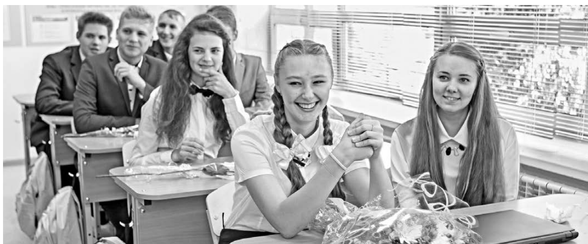
Девушек в «нефтяных» классах Туртаса не менее половины.