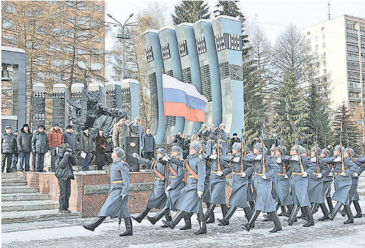
На Среднем Урале почтили память россиян, исполнявших служебный долг за пределами Отечества. В Екатеринбурге участники патриотической акции возложили цветы к мемориалу «Черный тюльпан». Кроме того, в 27 муниципальных образованиях Свердловской области почетные караулы несли вахту памяти у мемориальных досок и обелисков, посвященных подвигу погибших в боевых действиях воинов.