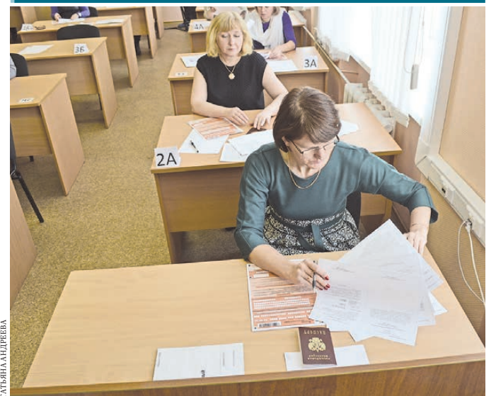
В Свердловской области прошел региональный этап акции «День сдачи ЕГЭ родителями», инициированной Рособрназором. За парты сели родители школьников из Екатеринбурга, Березовского, Верхней Пышмы, Дегтярска и других муниципалитетов. В качестве предмета для сдачи выбрали русский язык. Результаты будут известны примерно через неделю. Проект призван продемонстрировать объективность и открытость проведения аттестации.