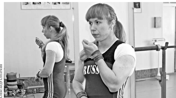
Алла Важенина пополнит копилку олимпийских медалей Казахстана.