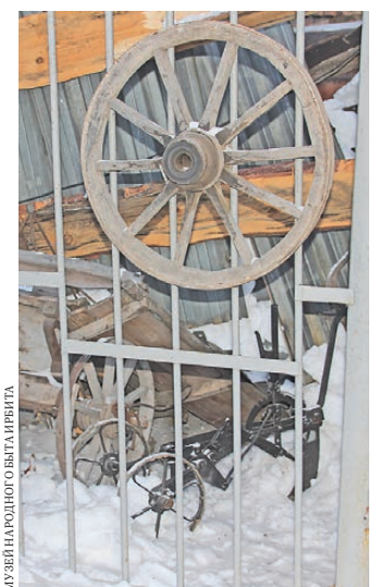
Обломки крыши погребли под собой открытую экспозицию.