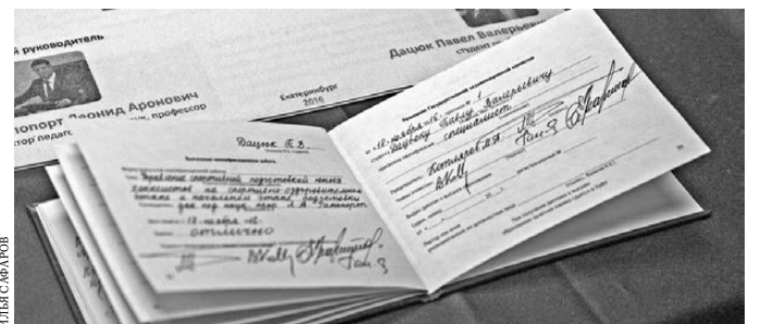
Именитый хоккеист стал специалистом по управлению в сфере физической культуры и спорта.