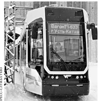
К саммиту ШОС-2020 по Челябинску будут курсировать новенькие трамваи усть-катавского производства.