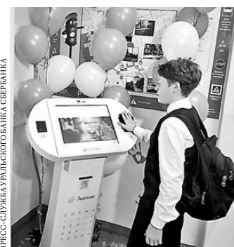
Первый на Среднем Урале терминал «Ладощки» установили в школе № 13 Полевского.