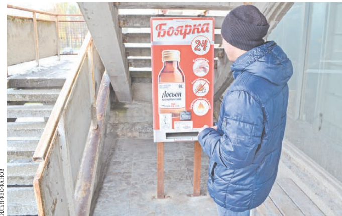
«Косметический лосьон» с 75-процентным содержанием спирта продают всем желающим.