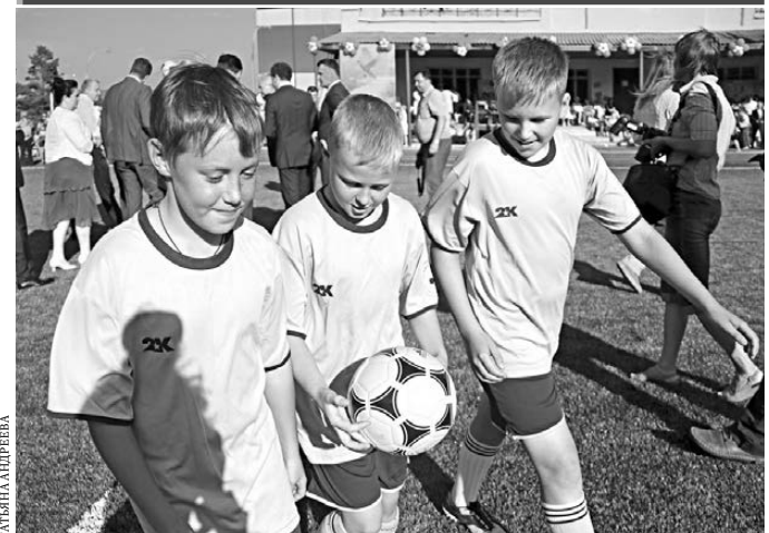
К 1 сентября в Нижней Туре Свердловской области завершили строительство всех площадок нового стадиона. Уже с начала учебного года ребята смогут здесь заниматься легкой атлетикой и игровыми видами спорта. А строители примутся за возведение бытового корпуса спорткомплекса, где разместятся раздевалки, кладовки.