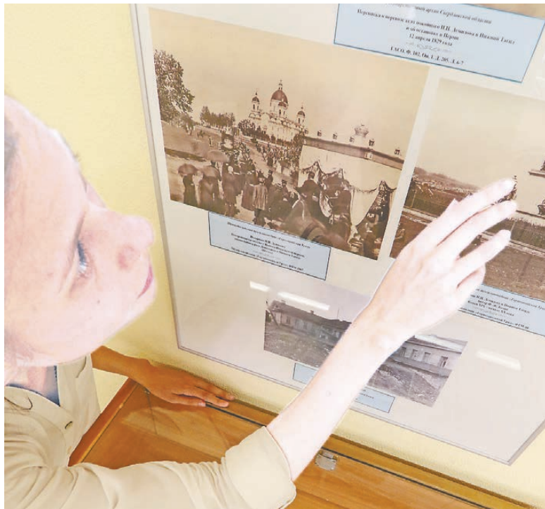
На выставке демонстрируются фотографии, связанные с потомками основателя династии.