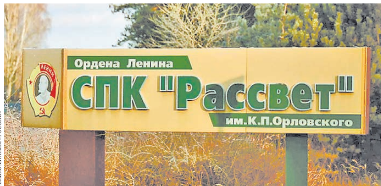
Бывший колхоз «Красный партизан» носит имя своего председателя.