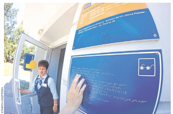
Отделение связи на 8 Марта, 57 в Екатеринбурге стало полностью доступно инвалидам, в том числе по зрению.

Для того чтобы узнать, подходит ли ближайшее почтовое отделение для посещения инвалидов, необходимо зайти на официальный сайт Почты России roschta.ru и ввести свой адрес. Перед вами появятся карточки почтовых отделений, на которых отображено, какие группы инвалидов они могут обслужить. Если полностью или даже частично доступных отделений рядом нет, вы можете вызвать курьера на дом. Он не только заберет письмо или посылку, но и поможет правильно оформить отправление. Телефон для вызова курьера указан на карточке отделения.