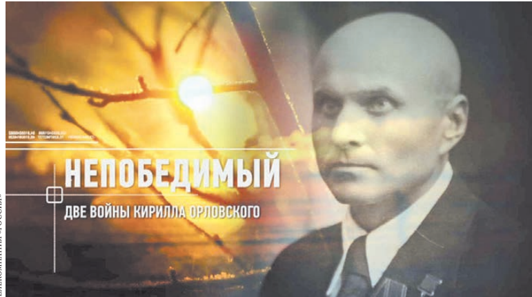
Заставка киноленты о Кирилле Орловском.

Известно, что в 20—30-х годах Кирилл Орловский работал в разведке и контрразведке в Советском Союзе, а в 1937 году был нелегал-