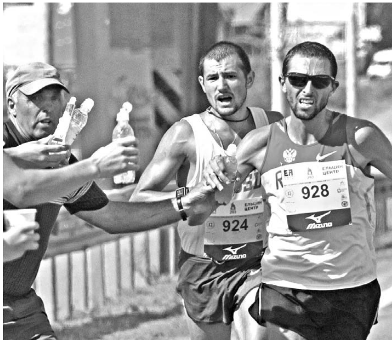
Августовский зной, не характерный для уральского климата, с трудом переносился участниками марафона.