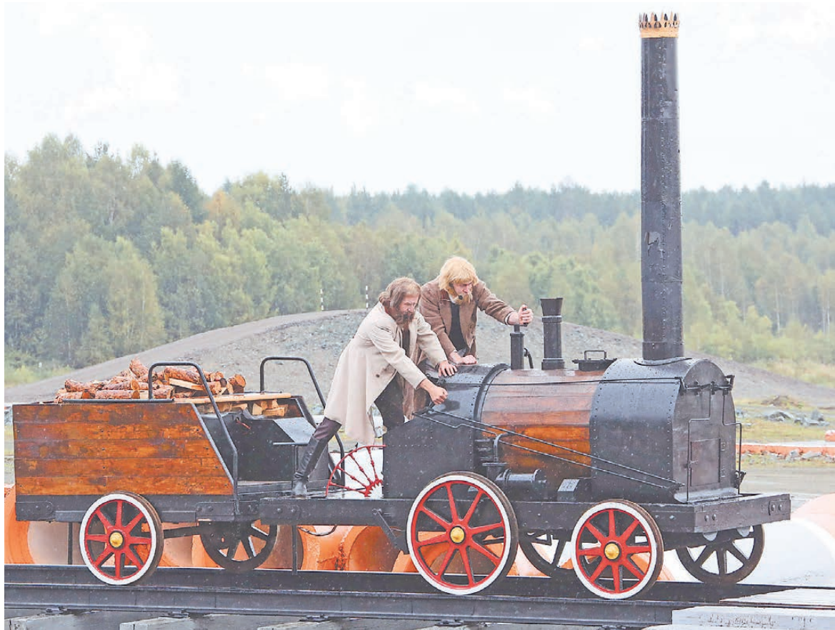
В Нижнем Тагиле построили действующий макет паровоза Черепановых.