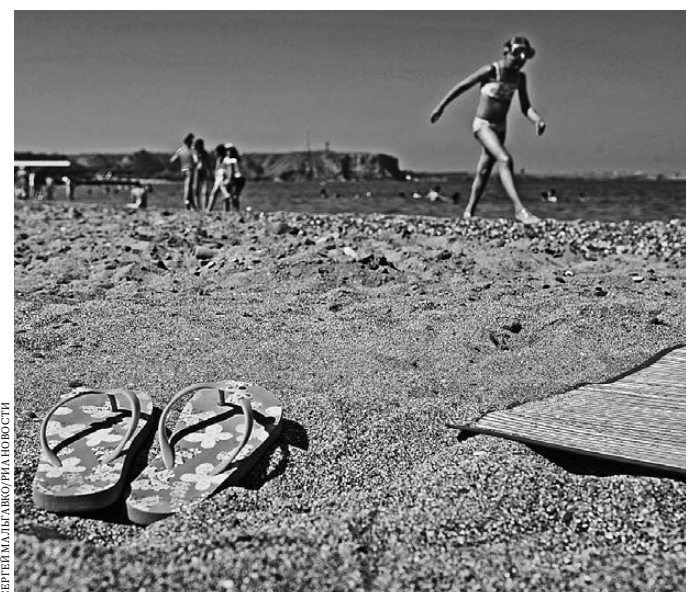
За детьми на водоемах нужен глаз да глаз.

Отдыхающим у водоемов спасатели вручают памятки, рассказывающие о безопасном поведении на воде и правилах оказания первой помощи. Номер для вызова экстренных служб — 112.