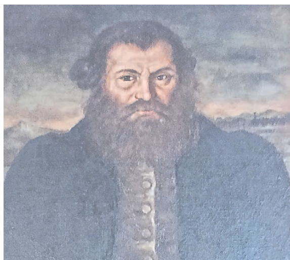
В Нижнетагильском краеведческом музее хранятся копии портретов Ефима (слева) и Мирона Черепановых.

Прим. ред.) которого возмела несчастные последствия и привлекла внимание, как вы можете убедиться из приложенной газеты. Его приняли за шпиона, и я боюсь, что подозрительная внешность и эта публикация, которую прочтут во всех