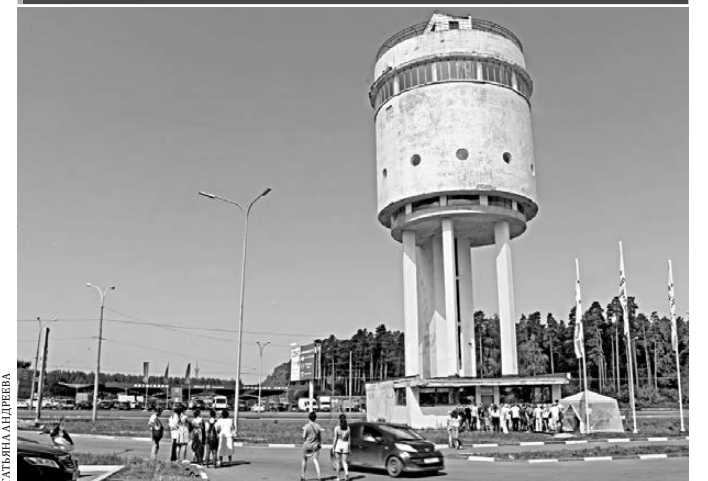
Завершен первый этап реконструкции Белой башни — екатеринбургского памятника конструктивизма. На первом этаже необычного сооружения залили новый пол, провели косметический ремонт и подключили электричество. На крыше установлена солнечная батарея, к которой подключена сигнализация. Стоимость работ оценивается в пять миллионов рублей, деньги собрали на краундфандинговых площадках. Вскоре в Белой башне начнут проводить экскурсии.