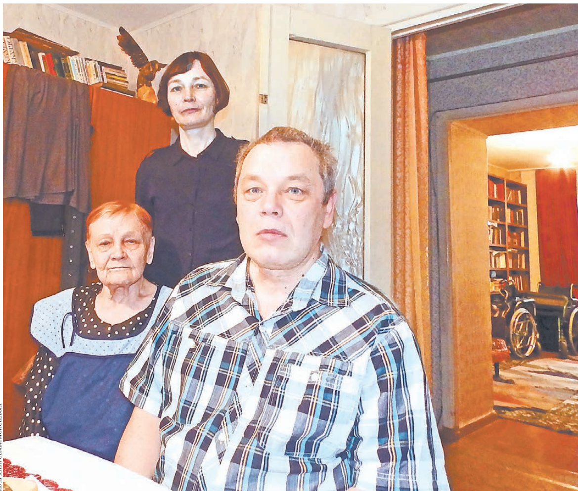
ЛЕВ АРХИВА СЕМЬИ МОИСЕЕВЫХ

19 апреля этого года оформил заявку на снятие со счета полторы тысячи долларов, а уже на следующий день брокер снял все оставшиеся там деньги — 12 349 долларов. Обратился к компании: что случилось? Мне ответили: списали всю сумму компенсаций за три года, так как я якобы злоупотреблял счетом для новичков, то есть «пе-