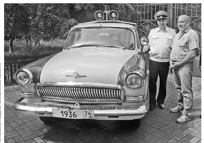
Железный ветеран правоохранительных органов заступил на почетную вахту перед зданием областного управления ГИБДД.