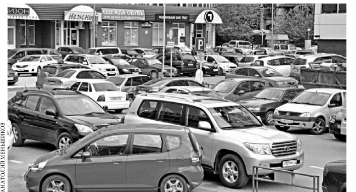
До трети сообщений, приходящих на портал, касается нарушений правил парковки.