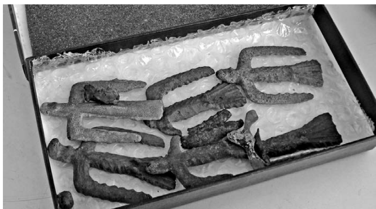
У древних металлургов птицеидолы были вместилищем души человека.