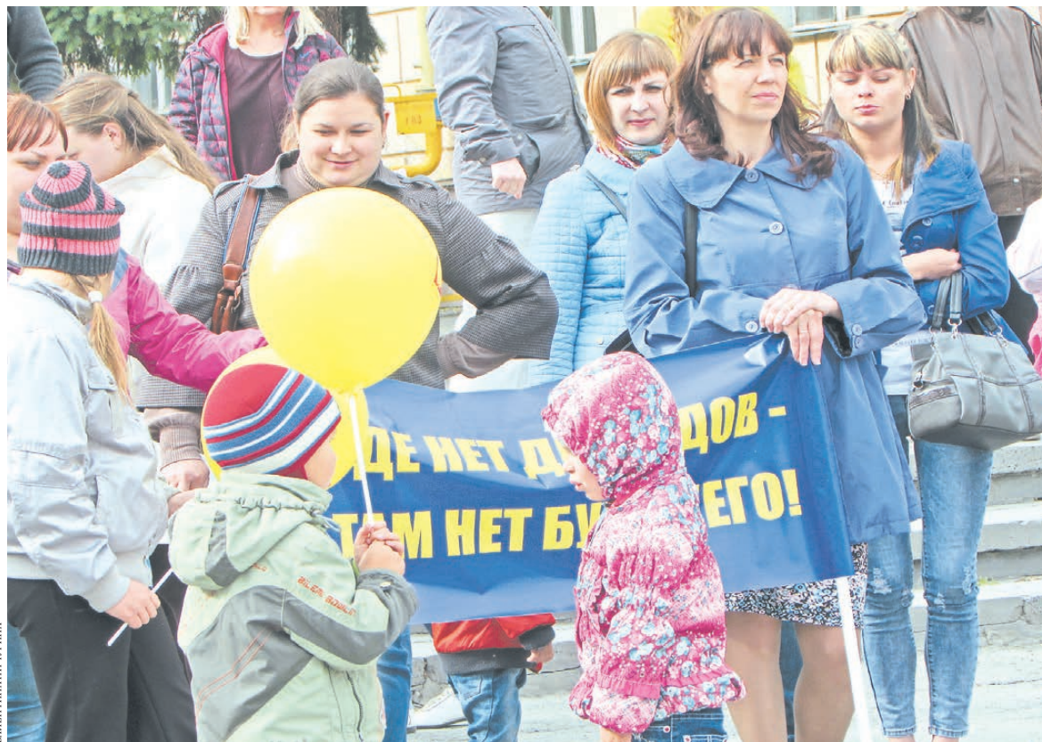
В День защиты детей курганские родители публично потребовали от властей соблюдения права на дошкольное образование.

Таких историй в Интернете десятки, в том числе и на портале областного департамента образова-