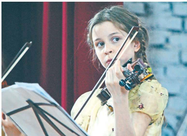
Выступление ансамбля скрипачей стало частью фестиваля День русского духа, ежегодно проводимого в Ницинском.

Проект «Встречайте, мы едем к вам!» завершится в сентябре гастролями оркестра народных инструментов в Североуральске.