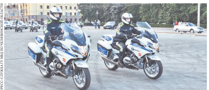
Челябинские полицейские оседлали немецкие мотоциклы.