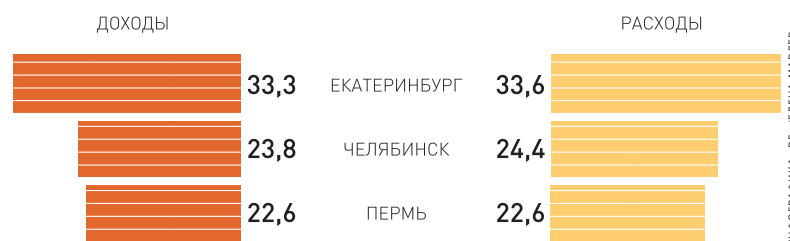
ИНФОГРАФИКА «РГ» / ЕЛЕНА МАРДЕР