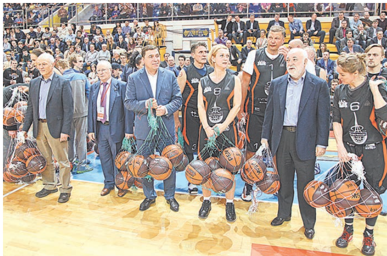
Школам Свердловской области передали профессиональные футбольные мячи «КЭС-БАСКЕТ».

— Основная суть и содержание нашего проекта — формирование ак-