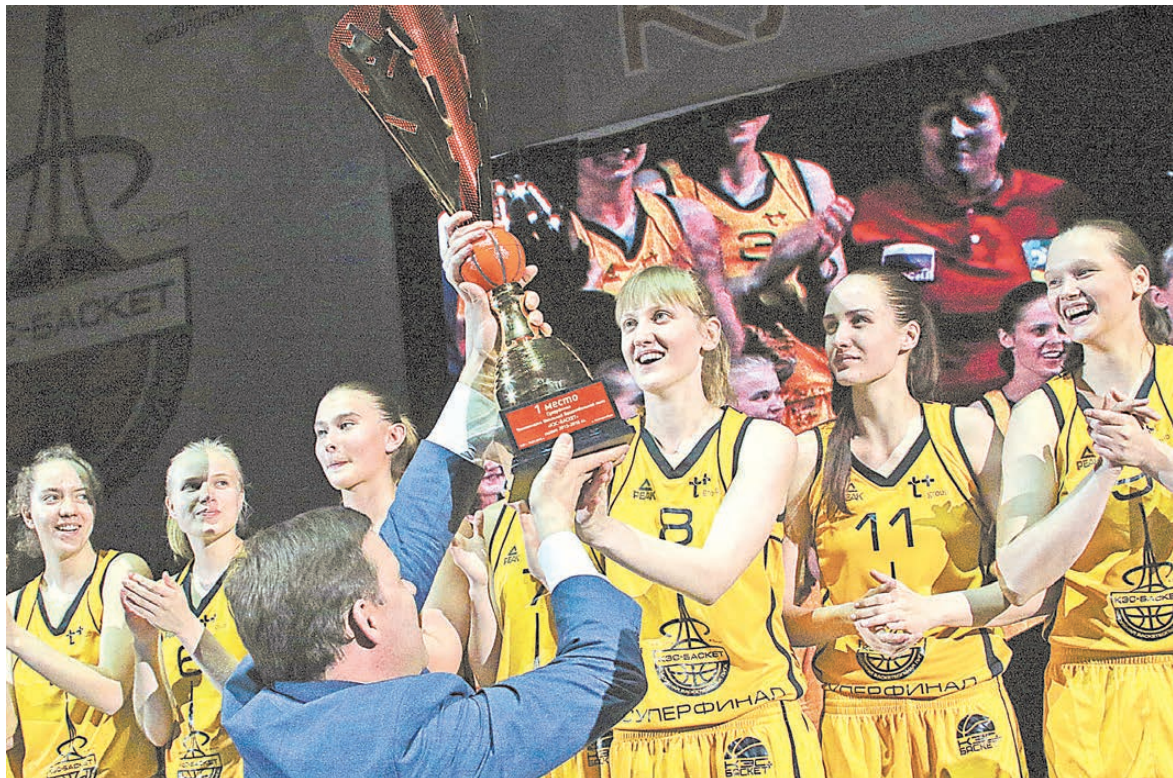
Первое место и Кубок чемпионата достались юным баскетболисткам из Новосибирской области.

В Екатеринбурге завершился чемпионат школьной баскетбольной лиги «КЭС-БАСКЕТ»