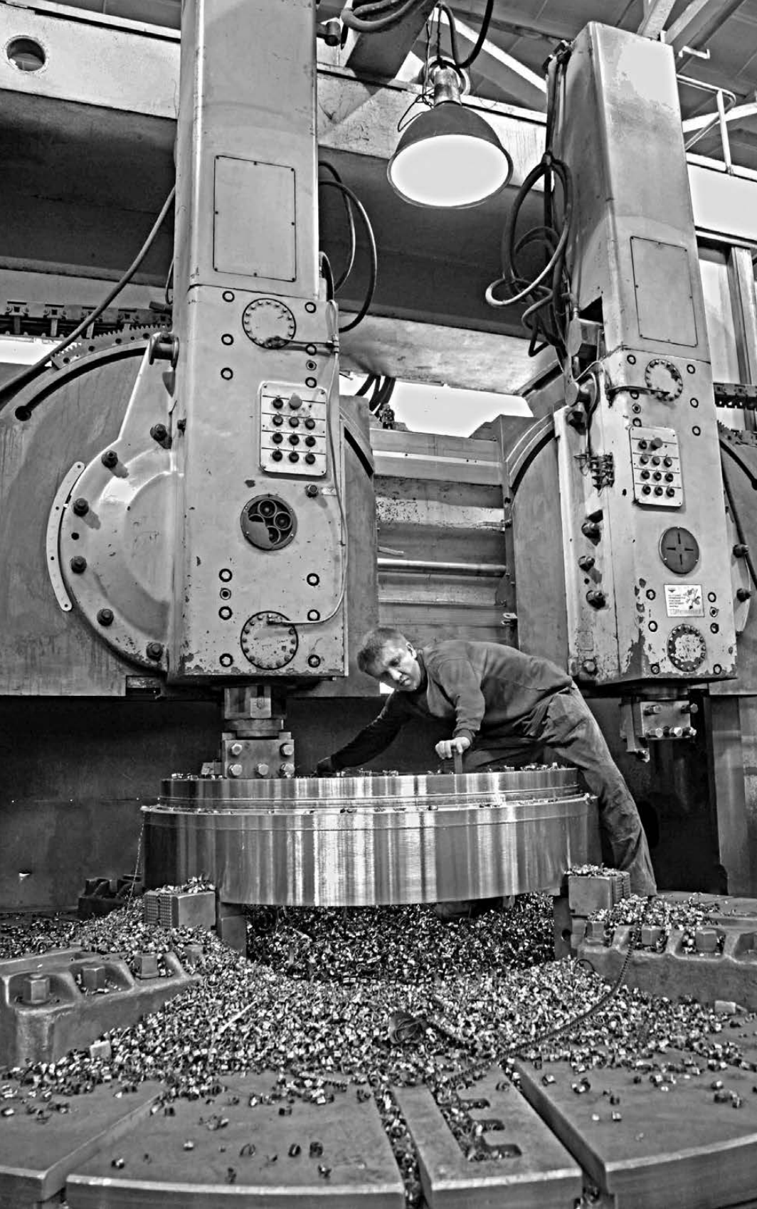
НА взаимозачеты могут решиться прежде всего предприятия, имеющие большое количество субподрядчиков или аутсорсинговых партнеров, например машиностроители, для которых изготавливает комплектующие ряд мелких предприятий.

Различные механизмы небанковских расчетов распространились в конце прошлого века в первую очередь из-за дефицита денежной массы. Другой причиной стало блокирование банковских счетов многих предприятий. Прямого сходства с нынешней ситуацией эксперты пока не видят, однако отмечают, что линейка платежных средств, доступных биз-