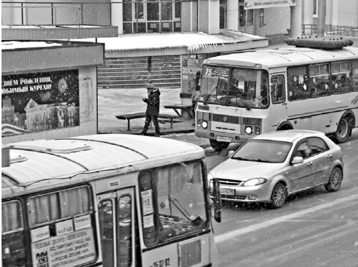
Кетовские автобусы идут через Курган и останавливаются на всех городских остановках.

Правда, конкурсы в Кетовском районе не пошли. Первый же сразу был оспорен перевозчиками в суде, его результаты признаны недействительными, как и заключенные по итогам контракта. После