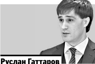
Руслан Гаттаров вице-губернатор Челябинской области