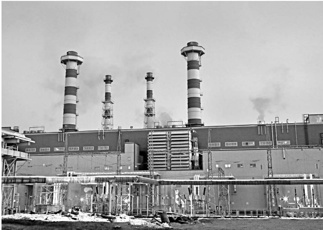
Общий объем инвестиций в строительство Нижнетуринской ГРЭС составил 20 миллиардов рублей.