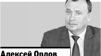
Алексей Орлов первый вице-премьер правительства Свердловской области