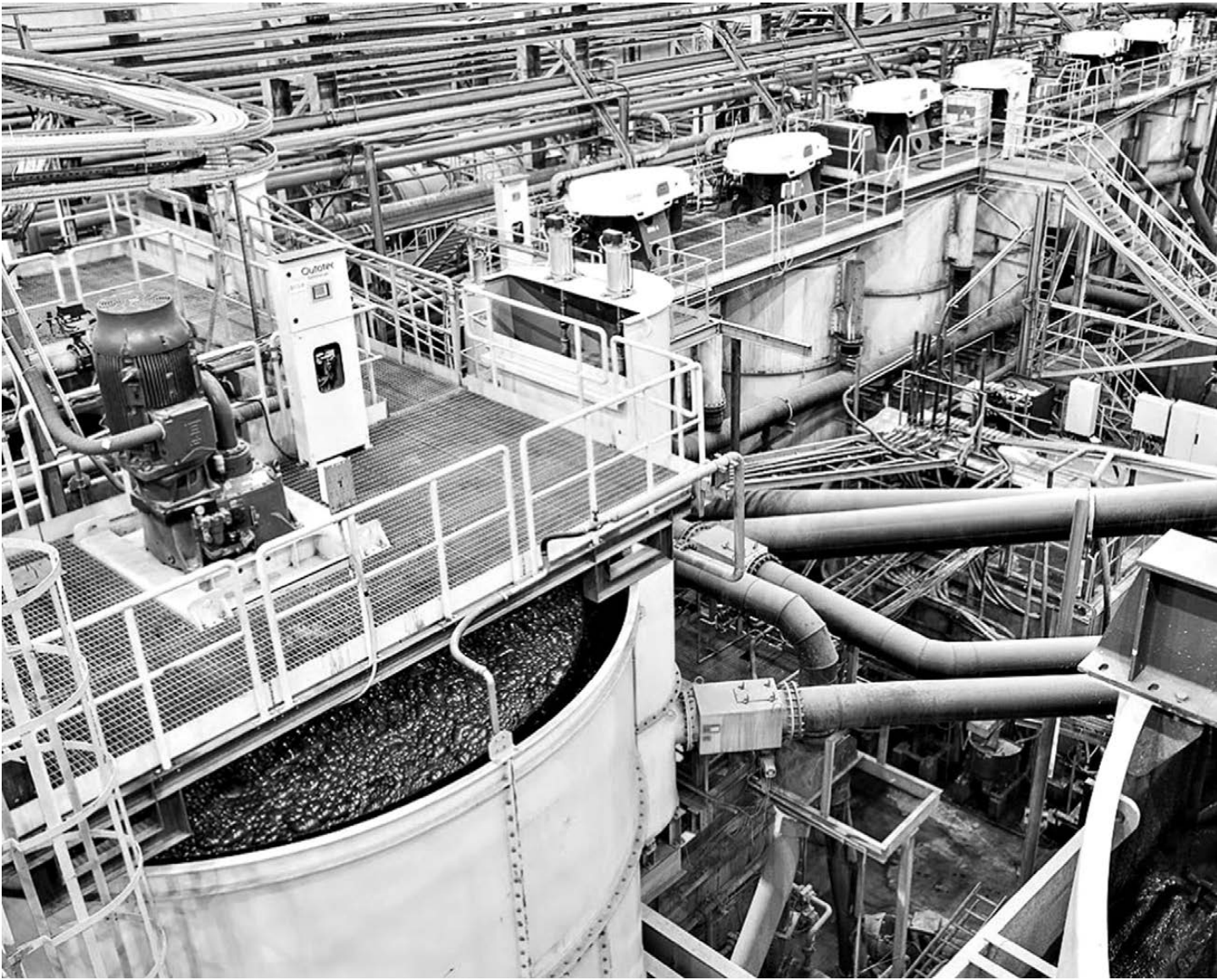
ПРОЦЕСС СЛУЖБЫ ГРУППЫ РМК

А что с таким показателем, как чистая прибыль?