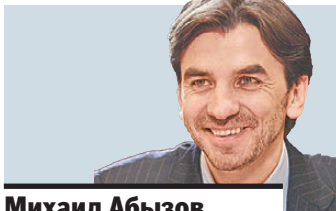
Михаил Абызов министр по вопросам открытого правительства РФ

БОЛЕЕ 152 тысяч абонентов Свердловской области не выполняют обязательств по оплате электроэнергии в течение одного-трех месяцев, их задолженность превысила 100 миллионов рублей. Около 80 миллионов задолжали 58 тысяч потребителей, не оплачивающих счета 3–6 месяцев. Почти 105,5 тысячи жителей не оплачивают электроэнергию более полугода. Их долг превышает 330 миллионов рублей.