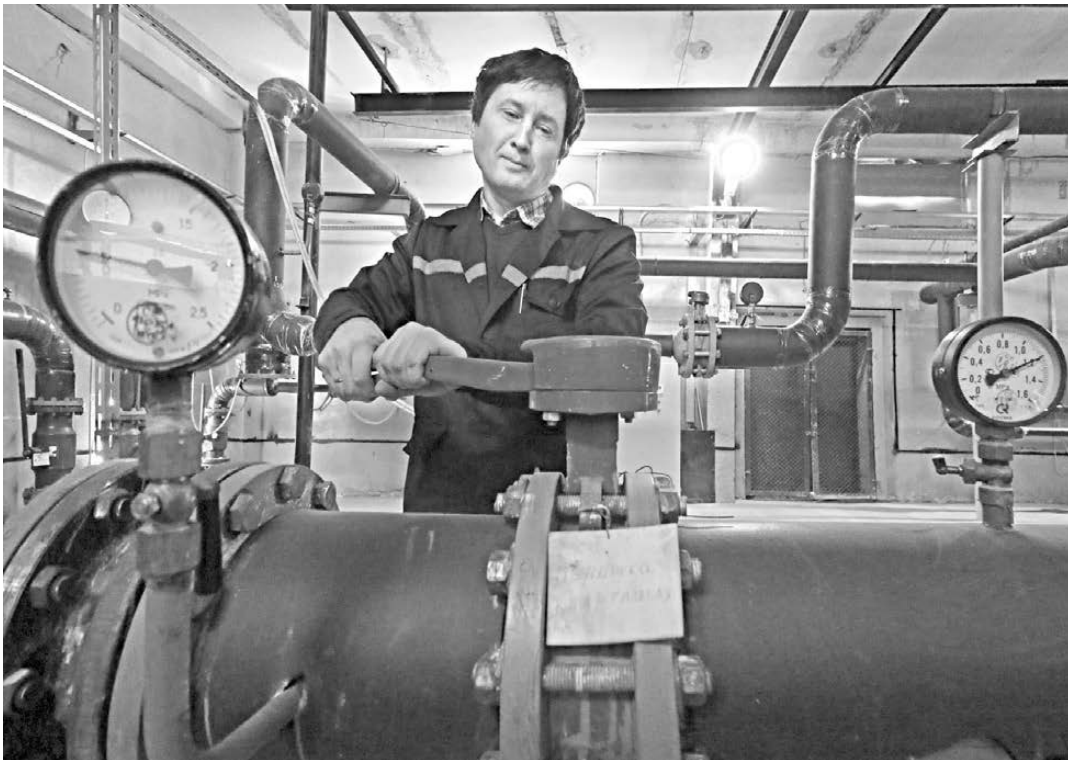
И крупные, и мелкие теплоисточники столицы Урала к осенне-зимнему периоду готовы.

смогут получить паспорт готовности к зиме, для оформления которого с прошлого года требуется акт финансовой готовности.