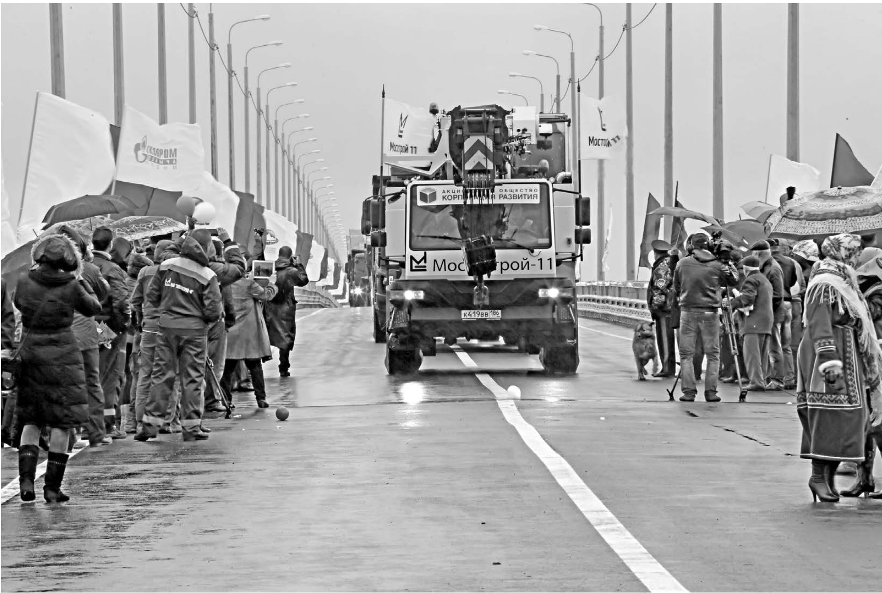
Открыто движение по автомобильной части моста через реку Надым. Это первый сданный в эксплуатацию отрезок Северного широтного хода: в дальнейшем по мосту пойдут и поезда. «Новая транспортная артерия необходима северянам как воздух, она соединит Ямал с центральной частью страны, на сотни километров сократит транспортные перевозки, свяжет близлежащие города и снизит уровень цен на жизненно необходимые товары. С этой дорогой в регион придет совершенно новое качество жизни», — подчеркнул полпред президента РФ в УрФО Игорь Холманских. Кроме полпреда в церемонии пуска важнеего для Ямала объекта приняли участие главы регионов «юменской матрешки» и сотни простых надымчан.