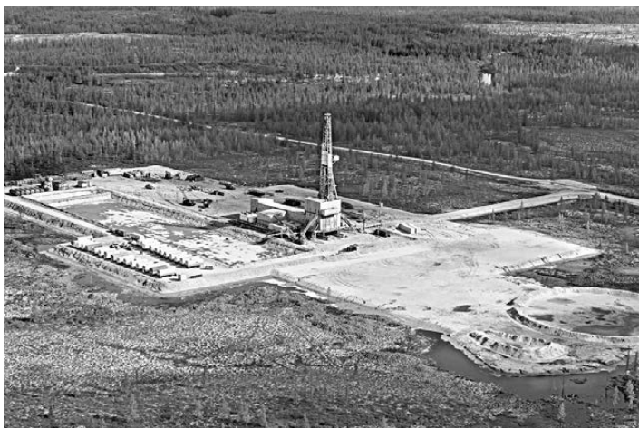
В августе на Заполярном месторождении приступили к бурению первой нефтяной скважины.