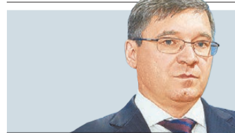
Владимир Якушев губернатор Тюменской области