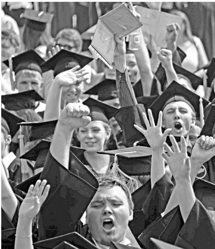
Сегодняшние выпускники УрФУ гордятся своей альма-матер, занимающей лидирующие позиции по многим показателям. Но у вуза есть и резервы для роста.

блемы не решаются, а усугубляются, их следует решать за круглым столом. Сегодня это получилось,—констатировал после трехчасового общения с коллективом УрФУ Владимир Бурматов. Депутат пообещал держать ситуацию на контроле и вновь посетить университет в начале сентября.