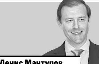
Денис Мантуров министр промышленности и торговли РФ