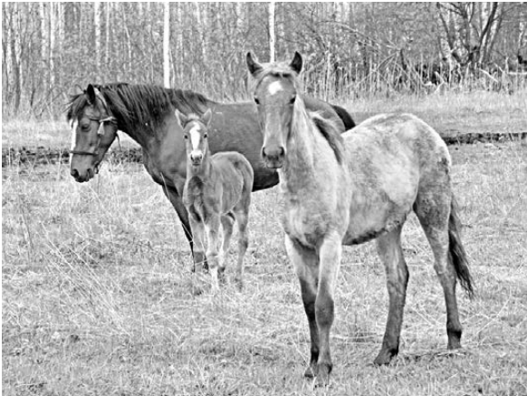
Лошади и коровы, принадлежащие частникам, порой вытаскивают у фермеров до 70 процентов посевов.

Вместе с тем глава надзорного ведомства считает важным определить правила ведения личного хозяйства, в частности, нормы содержания скота. Зачастую на подворьях содержится свыше 50 голов скота, что значительно превышает потребность одной семьи. Если владелец разводит скот в промышленных масштабах, он должен регистрироваться как фермер, платить налоги и нести соответствующую ответственность за свою собственность. Возможно, тогда и проблема потравы перестанет стоять столь остро.