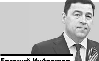
Евгений Куйвашев губернатор Свердловской области