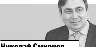
Николай Смирнов министр энергетики и ЖКХ Свердловской области