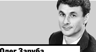
Олег Заруба губернатора Тюменской области