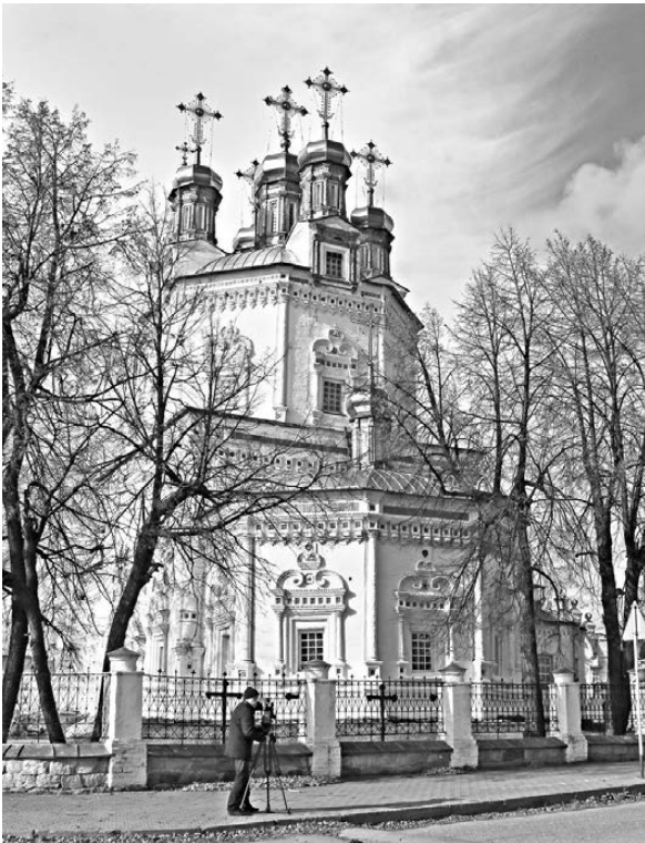
Уникальные храмы и монастыри духовной столицы Урала и сегодня привлекают паломников и любителей истории со всей страны.

—Необходимо обеспечить детей местами в детских садах, некоторые категории граждан — жильем, в том числе переселить их из аварийных домов. Требуется протянуть в Верхотурье газопровод высокого давления, построить газораспределительные сети на территории города, а также коммуникации водо- и теплоснабжения, — перечислили задачи, заложенные в программе, в департаменте информационной политики губернатора.