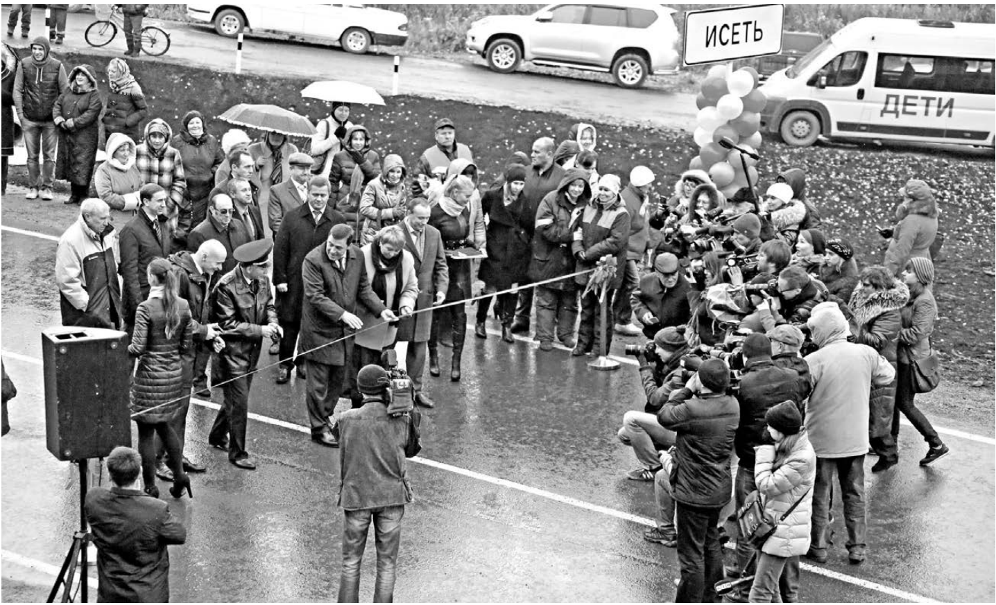
На Среднем Урале открыли новую дорогу. Асфальтированная трасса протяженностью 10 километров соединила поселки Исеть и Сагра. Общая стоимость проекта превысила 458 миллионов рублей. — Это важное событие для всего региона, так как оно в значительной степени способствует решению главной задачи — повышению качества жизни уральцев. Дорога создаст новые перспективы развития территории, — отметил губернатор Свердловской области Евгений Куйвашев после того как лично опробовал новую трассу, добравшись из одного поселка в другой всего за семь минут.