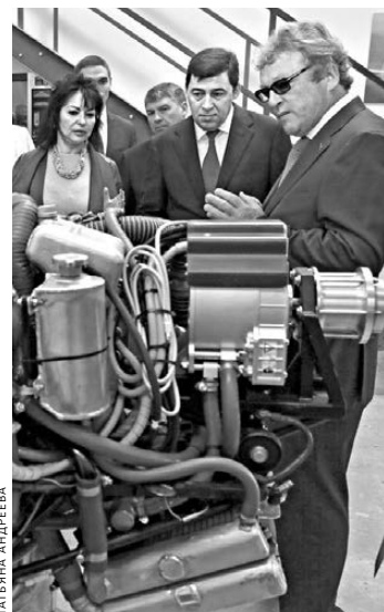
Губернатор Евгений Куйвашев (в центре) осматривает производство самолетов «Даймонд» в Австрии.

Ожидается, что, после того, как в регионе освоит выпуск 9-ти и 19-местных самолетов, здесь приступят к производству двухмоторных машин «Даймонд ДА-42 Твин Стар» и других воздушных судов, которые могут использоваться на региональных авиалиниях, а также в качестве авиатакси. Кроме того, самолеты «Даймонд» планируется задействовать для воздушной фото- и видеосъемки и патрулирования, в том числе обширных лесных массивов. Отметим также, что УЗГА выиграл тендер на проектирование самолета ДА-42Т для нужд Министерства обороны РФ.