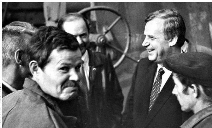
Директор Николай Рыжков среди работников Уралмашзавода.

Сегодня Николай Иванович тоже не остается в стороне от беде проблем некогда единой страны. Он возглавляет при Совете Федерации комитет общественной поддержки жителей юго-востока Украины. Ведь сам — уроженец Донецкой области, внук и сын шахтеров, в Краматорске окончил техникум. И в этой деятельности также проявляется широта его души, сердечность, сопереживание, радушие, готовность помочь, которые так хорошо известны ветеранам Уралмашзавода. Они, кстати сказать, частые гости у Николая Ивановича. На день рождения тоже собираются: