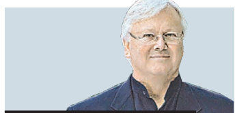
Адриан Смит архитектор, автор проекта Burj Khalifa (828 метров) в Дубае