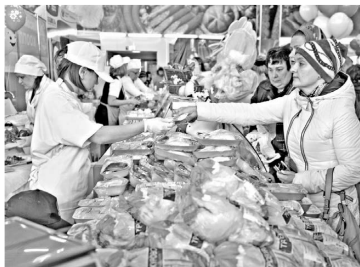
На ярмарках в северных автономиях продовольственные товары тюменских производителей пользовались огромным успехом.

В конце прошлой недели в Тюмени состоялось совещание по вопросу обеспечения продовольственной безопасности регионов в связи с введением запрета на импорт продуктов. Главы регионов тюменской «матрешки» заверили, что ситуация на продовольственном рынке под контролем. Разработаны специальные механизмы наблюдения за насыщенностью рынка и контроля цен.