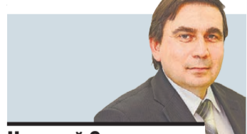
Николай Смирнов министр энергетики и ЖКХ Свердловской области