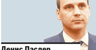
Денис Паслер председатель правительства Свердловской области

1,0 ИНОМАРОК одновременно уничтожено в Тюмени после судебных решений об их утилизации: автомобили не соответствовали техрегламенту по выбросу вредных веществ. Ранее ГИБДД конфисковала машины у владельцев, поместив на штрафстоянку.