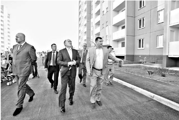
Борис Дубровский (в центре) осматривает два новых дома в Южноуральске, куда из ветхо-аварийного жилья переехали 244 семьи.

В Челябинской области активно развивается не только многоэтажное, но и индивидуальное жилищное строительство. Так, в Магнитогорске с начала года его объемы выросли в 2,4 раза, в Златоусте — в 3,7, в Карабаше — в 8,7 раза. В целом по региону на долю ИЖС приходится треть от общего количества вводимого жилья.