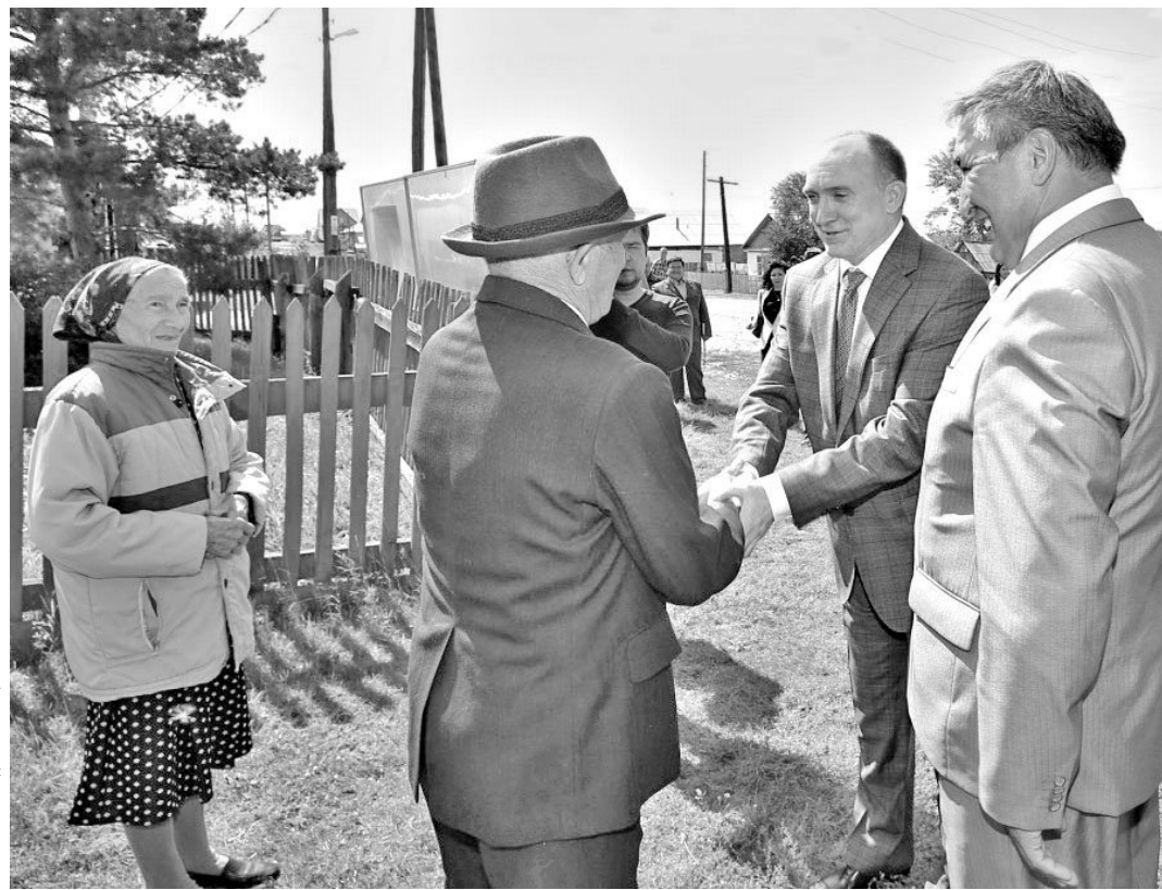
ПРИ ПОСРЕДСТВЕ АДМИНИСТРАЦИИ ЧЕЛЯБИНСКОЙ ОБЛАСТИ

По мнению экспертов, в сфере газификации в регионе наблюдается настоящий прорыв. Финансирование целевой программы по сравнению с прошлым годом увеличено в 3,5 раза. В 2013-м на эти цели из бюджета было направлено немногим более 160 миллионов рублей, удалось проложить 131 километр сетей и подключить 9,7 тысячи квартир и домов. — Использование природного газа позволит существенно улучшить качество жизни, особенно в селах. А это одна из задач недавно принятой стратегии развития региона, — подчеркивает исполняющий обязанности губернатора Челябинской области Борис Дубровский. — О необходимости наращивания темпов газификации говорили главы муниципалитетов, активисты общественных и политических организаций, рядовые жители во время рабочих поездок. И мы решили пойти им навстречу. Интересно, что дополнительные источники финансирования для программы искать не пришлось. Все 500 миллионов были получены за счет экономии расходов бюджета. Как сообщили в областной администрации, в приоритетном порядке средства будут направляться на объекты, где