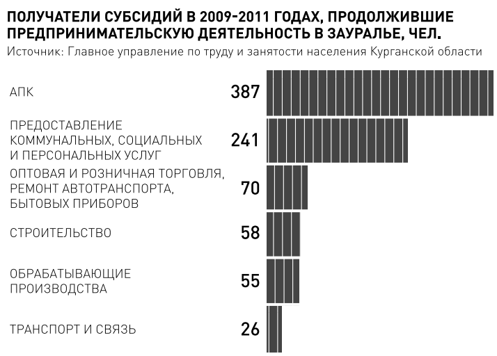
ИНФОГРАФИКА: РС, ЕЛЕНА МАРШЕР

ЦИФРА 20 ПРОЦЕНТОВ техногенных отходов перерабатывается в России, в то время как в мире этот показатель достигает 85–90 процентов