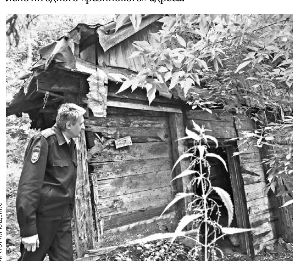
С первого раза эту полусгнившую избушку в овраге даже не найти, но по документам она вместила 148 гастарбайтеров.

Сотрудники контролирующих органов ссылаются на то, что крайне непросто отследить, какой по счету постоялец регистрируется по тому или иному адресу. Постановка мигрантов на учет уже несколько лет носит уведомительный характер. Для проверки всех адресов элементарно не хватает рук. В глаза бросаются те, где мигранты зарегистрированы сотнями. А сколько квартир, где «прописано» по два-три десятка человек? Думаем, немало. В прошлом году, по данным УФМС, в Тюменской области на учет было поставлено 145 тысяч иностранцев. За шесть месяцев этого года — почти 75 тысяч. Где-то же они осели. Очевидно, что большинство — в Тюмени, ведь в сельских районах пока не выявлено ни одного «резинового» адреса.