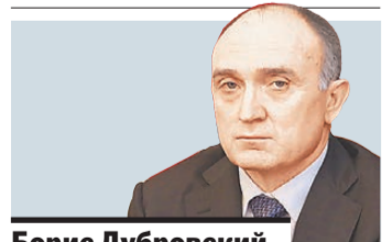
Борис Дубровский и.о. губернатора Челябинской области