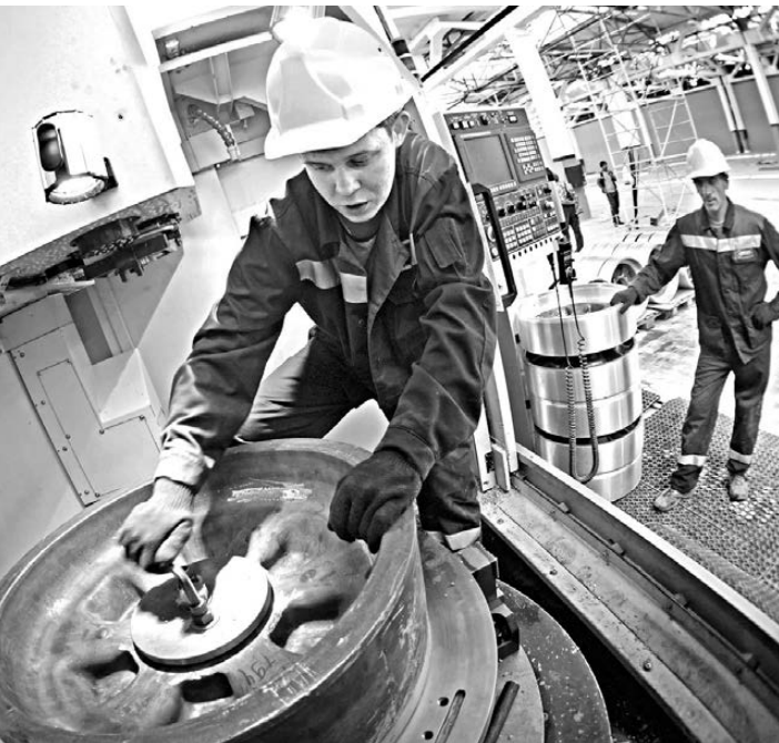
Пуск нового производственного участка позволит Уральшине меньше зависеть от смежников и распределить загрузку более равномерно.

Оптимизация приносит свои плоды. Так, выручка Уральщины