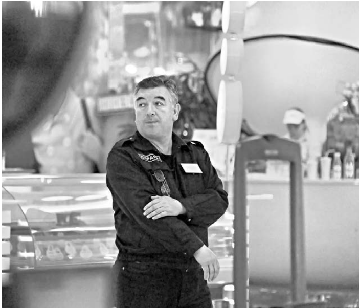
Убытки от краж в магазинах самообслуживания неизбежны: к каждому батону колбасы охранника не приставишь.