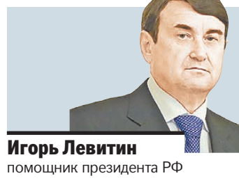
Игорь Левитин помощник президента РФ