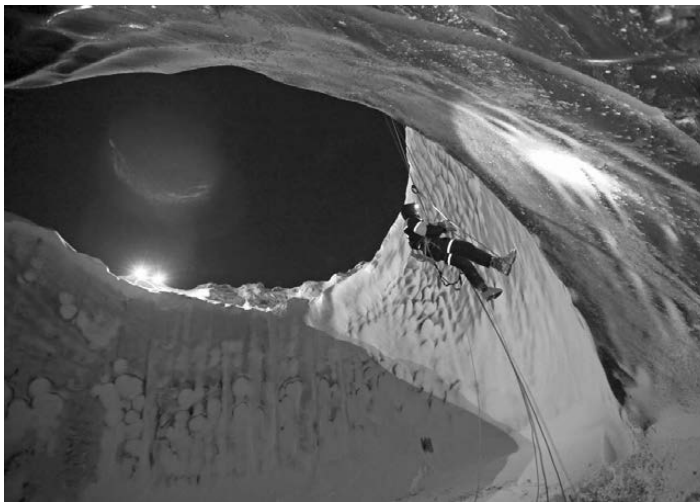
На месте вспучивания грунтов впоследствии происходил мощный выброс метана с образованием глубокой воронки.

Другие ученые не исключают прорыва к поверхности метана с больших глубин. Для выяснения истины на Ямал едут одна экспедиция за другой. К очередной готовности участников проекта Тюменского индустриального университета «Повышение эффективности освоения Арктической зоны РФ».