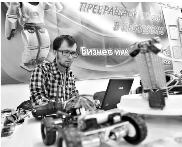
В Шадринском бизнес-инкубаторе мечтают о создании центра технического творчества для детей и взрослых.