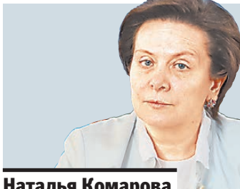
Наталья Комарова губернатор Югры

338 НЕЗАКОННЫХ рекламных конструкций ликвидировано в мае в Екатеринбурге. При этом выявлено еще 150 самовольно установленных объектов. Всего в 2014 году специалисты проверили 2256 рекламных конструкций и выяснили, что 976 из них установлены собственниками самовольно. Демонтировано почти 750 билбордов, щитов, баннеров и перетяжек.