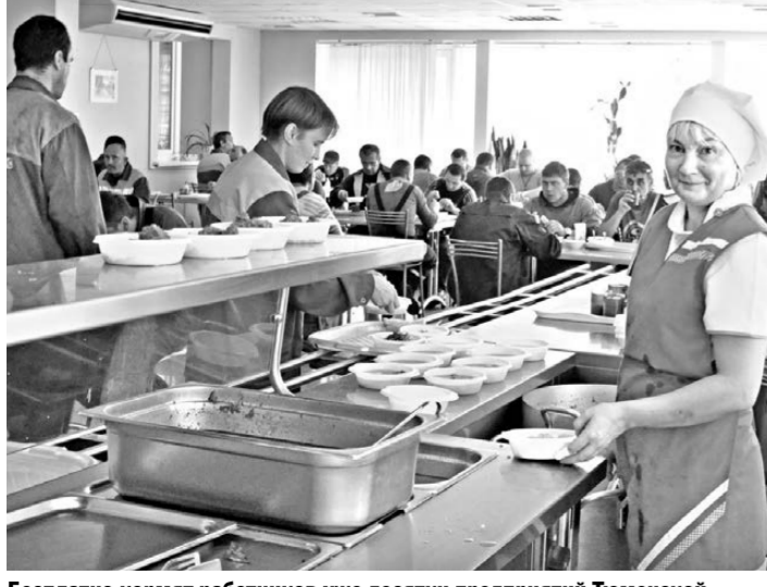
Бесплатно кормят работников уже десятки предприятий Тюменской области.

ЦИФРА 116 МИЛЛИОНОВ рублей получили в 2013 году 650 субъектов малого и среднего предпринимательства Челябинской области из бюджетов всех уровней