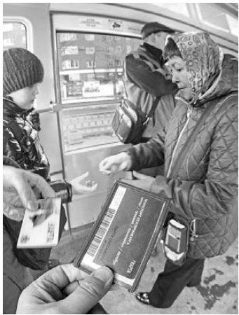
Фактически реформа общественного транспорта началась с переезда для кошельков пассажиров.

В администрации города коммерческих перевозчиков даже не удосужились собрать, чтобы объяснить механизм. Просто поставили перед фактом