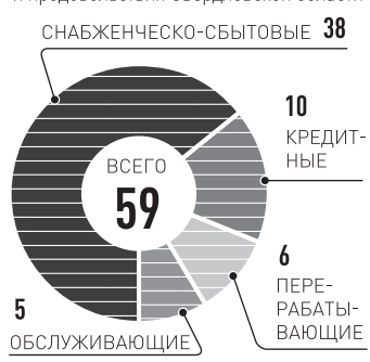
ИНФОГРАФИКА: РГ, ЕЛЕНА МАЙЕР

Источник: министерство АПК и продовольствия Свердловской области