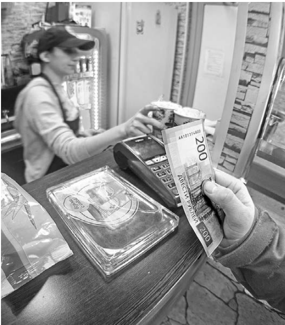
И в торговых сетях, и в мелких магазинчиках Урала продавцы готовы к работе с новыми банкнотами.

В ЦБ обращают внимание на то, что банкноты новых номиналов — законные и обычные средства платежа: они не являются памятными, их тираж неограничен. Отказываться в их приеме не имеет права. Если все-таки потребители столкнулись с такой проблемой, они могут обратиться с жалобой в интернет-приемную на официальном сайте Банка России или в Роспотребнадзор. Торговым точкам, отказавшим в приеме новых банкнот, грозит административный штраф до 50 тысяч рублей. Но пока ни одной жалобы такого рода в управление ЦБ не поступало.