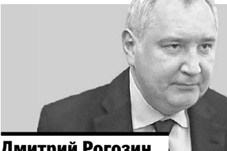
Дмитрий Рогозин, заместитель председателя правительства РФ