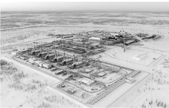
ПРЕСС-СЛУЖБА «ГАЗПРОМ ДОБЫЧА ЯМБУРГ»

Компания «Газпром добыча Ямбург» в 2017 году направила в единую систему газоснабжения более 150 миллиардов кубометров голубого топлива — это более 30 процентов от годовой добычи всего Газпрома. Объем извлеченного газового конденсата превысил четыре миллиона тонн, а план по приросту запасов углеводородов выполнен на 162 процента. В минувшем году завершен проект подключения дополнительных скважин нижнемерловых отложений Ямбургского нефтегазоконденсатного месторождения, введено в эксплуатацию новое оборудование на Заполярном месторождении.