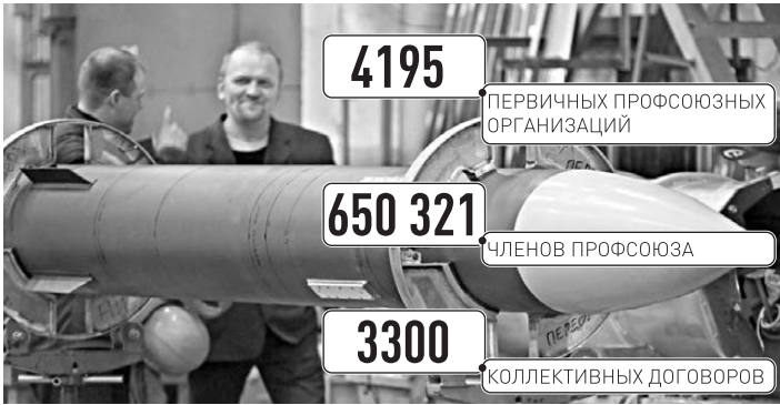
ИНФОГРАФИКА: РГ, ЕЛЕНА МАЙЕР

Источник: Федерация профсоюзов Свердловской области