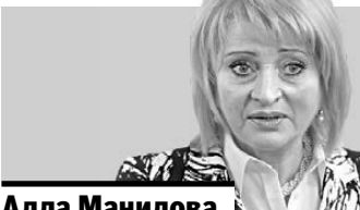
Алла Манилова, заместитель министра культуры РФ