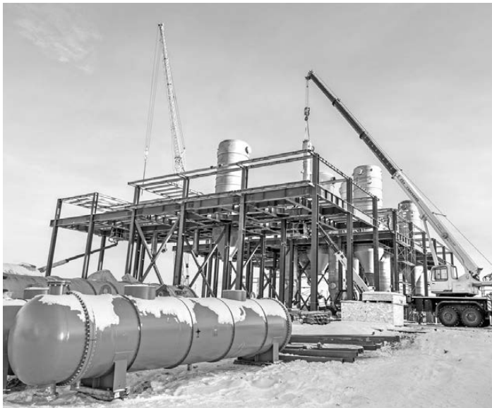
В здании «этажерки» монтируют 18 массивных сепараторов, в последующем это будет закрытый и утепленный производственный корпус.