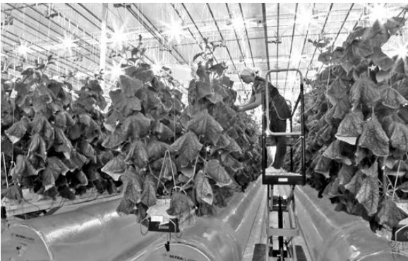
Благодаря новым тепличным технологиям овощи созревают гораздо быстрее.

Свердловские овощеводы впервые вырастили огурцы в декабре. Для этого в АО «Тепличное» (входит в УТМК-Агро) включили дополнительное освещение. Благодаря современным технологиям первые овощи в новых теплицах созрели уже через три недели после высадки саженцев (раньше урожай приходилось ждать 1,5–2 месяца). Кроме того, местная продукция была доступна только с марта по октябрь. В первый же день собрано пять тонн огурцов, а после Нового года урожайность достигнет 20 тонн. Первые декабрьские огурчики оценили шеф-повара ведущих ресторанов Екатеринбурга. Самой необычной оказалась просба шеф-повара, приехавшего на Урал из Франции: Маттиас Грожан отметил, что с удовольствием бы использовал в своих блюдах огурцы с цветками, которые в России принято удалять.