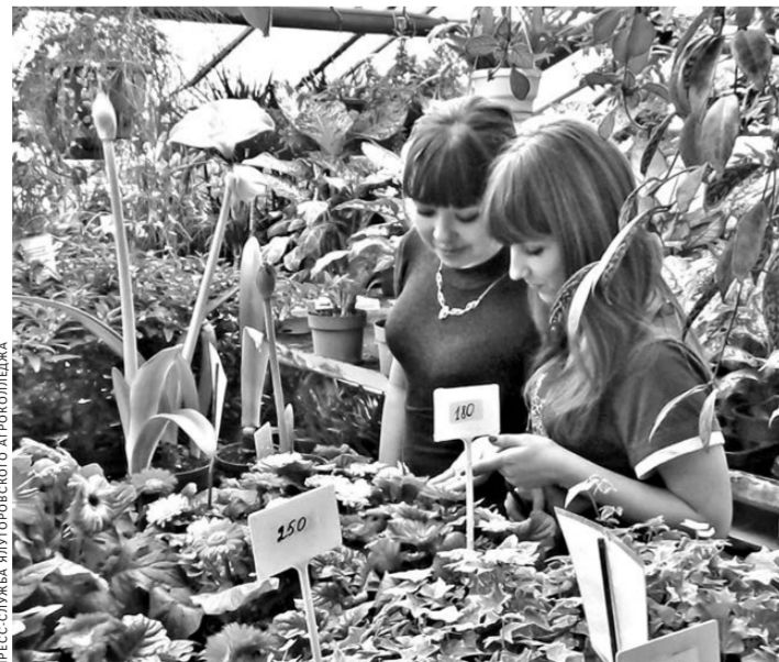
Учащиеся аграрных классов побывали на экскурсиях на большинстве успешных сельхозпредприятий ближайших районов.

— Важно сформировать у южноуральцев мотивацию к саморазвитию, определенную жизненную позицию. Невысокий уровень финансового кризиса многим напомнил, что нельзя забывать о реальном секторе экономики. И цели, которые поставлены в Стратегии 2020, сводятся, по сути, к одному: Челябинская область должна стать зоной опережающего развития, причем за счет собственных ресурсов. Для этого необходимо подготовить людей, нацеленных на производство и создание.