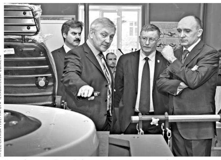
И.о. губернатора Борис Дубровский (справа) в научно-образовательном центре ЮУрГУ наметил перспективы выпуска инновационной продукции. Остается решить только кадровую проблему.