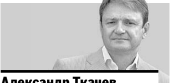
Александр Ткачев, министр сельского хозяйства РФ