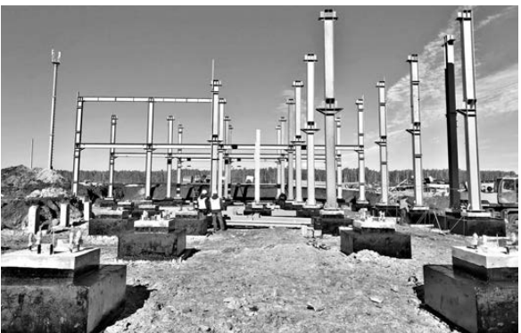
На стройплощадке Томинского ГОКа полным ходом идет работа.

Томинский ГОК (входит в Русскую медную компанию) приступил к возведению главного корпуса обогатительной фабрики и других капитальных объектов в Сосновском районе Челябинской области. К концу 2019 года планируется построить 17 зданий. Сейчас на стройплощадке задействовано 200 человек и 45 единиц техники. На июль 2017 года инвестиции в проект оцениваются более чем в 65 миллиардов рублей, это будет самый масштабный и современный комбинат в отрасли. Инновационные технологии позволят обогащать медно-порфировую руду с содержанием меди всего 0,4 процента. На будущем предприятии планируют внедрить стандарт «Умная медь», который предполагает максимально эффективное, высокотехнологичное и экологически безопасное производство.