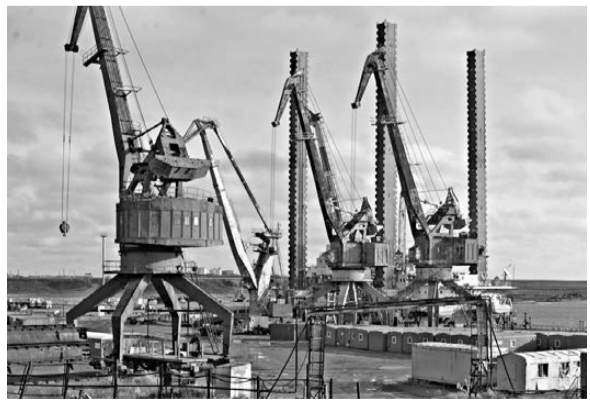
«Амазон» пришвартовался в порту Ямбурга на Карском море.

В порт Ямбург доставлена после трансконтинентального путешествия самоходная плавучая буровая установка «Амазон», изготовленная в XX веке в Норвегии и принадлежащая «Газпром флоту». Этим летом она работала в Черном море, откуда ее вернули в Заполярье: через Суэцкий канал довели до порта Сабетта на китайском океанском «грузовике», а затем отбуксировали в Ямбург. Установка весом 6,6 тысячи тонн способна выдержать штормовую волну высотой почти девять метров при максимальной скорости ветра в 27,8 метра в секунду и бурить скважины глубиной до трех километров. С помощью «Амазона» на шельфах Карского моря открыты месторождения газа совокупным объемом свыше триллиона кубометров. Работа по поиску углеводородов в акватории продолжится.