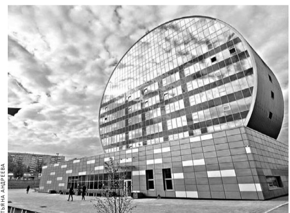
Лучшим социальным объектом признан инновационный культурный центр Первоуральска.

— Строительная отрасль сделала огромный рывок за счет теплереволюции, использования современных материалов и технологий. Это позволяет сегодня в России строить не хуже, чем в любой другой стране, а выигрывает в конечном счете потребитель.