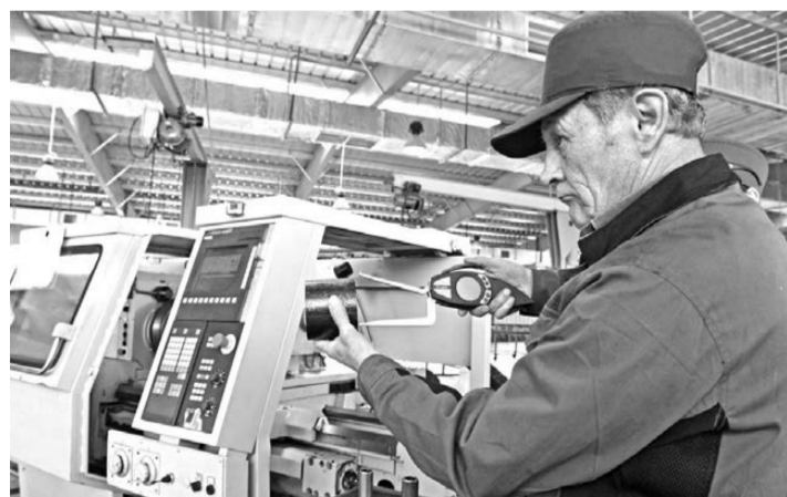
На предприятии в Нижнетавдинском районе будет создано около 150 рабочих мест.

Надо полагать, что это далеко не последние совместные с немцами проекты. Вчерашний регион прибыла очередная делегация из ФРГ, в составе которой бизнесмены, банкиры, представители социальной сферы. Программа визита очень насыщенная: в течение пяти дней гости посетят новые промышленные объекты, в частности завод по производству буровых установок и предприятие, выпускающее нефтепогружную кабель. Запланирована поездка на завод «Тобольск-полимер». Потенциальным инвесторам покажут инфраструктурные площадки для перспективного размещения химического производства. Кроме того, стороны намерены вернуться к обсуждению возможностей реализации совместных проектов в области деревообработки и энергетики, в частности по производству биогаза, а также проекта по утилизации промышленных и бытовых отходов.