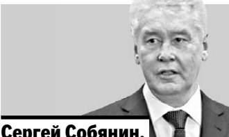
Сергей Собянин, мэр Москвы