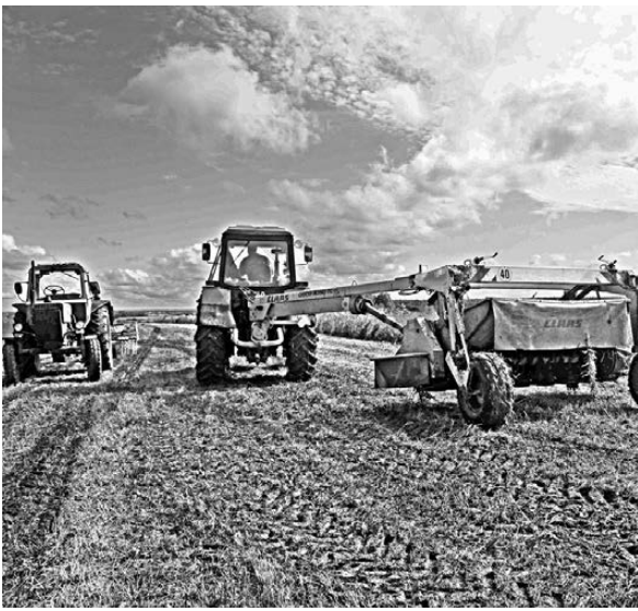
После затяжных июньских дождей аграриям непросто даже засеять на поле — машины вязнут в грязи. Однако заготовка кормов в регионе все же началась.

Если в июле — августе средняя температура все же установится в пределах 23–25 градусов, это компенсирует издержки первого месяца лета для всех культур, включая самые теплолюбивые. Но придет ли на Урал тепло и много ли еще прольется дождей, дополнить неизвестно: синоптики, как водится, не берутся делать долгосрочные прогнозы. А краткосрочный неутешителен: по сообщениям гидрометеослужбы, вся первая декада июля ожидается дождливой.