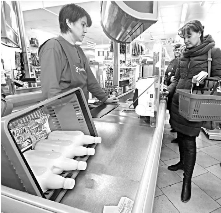
Новую кассовую технику успели вовремя получить лишь самые предусмотрительные предприниматели, оплатившие ее еще в прошлом году.

«Хронический дефицит» (термин официального производителя) вызвал появление спекулян-