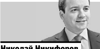
Николай Никифоров, министр связи и массовых коммуникаций РФ